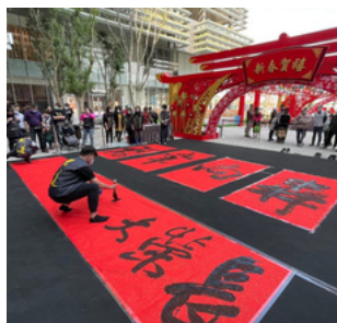
南紡購物中心 -新春報喜齊揮毫活動