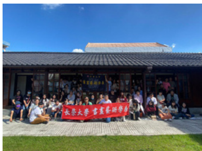
六龜池田屋 - 全系寫生活動