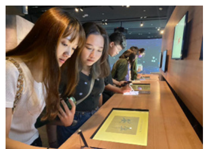
故宮南院參訪 -書法新媒體互動展