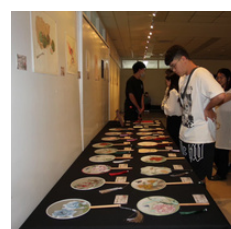
書畫系小品展開幕